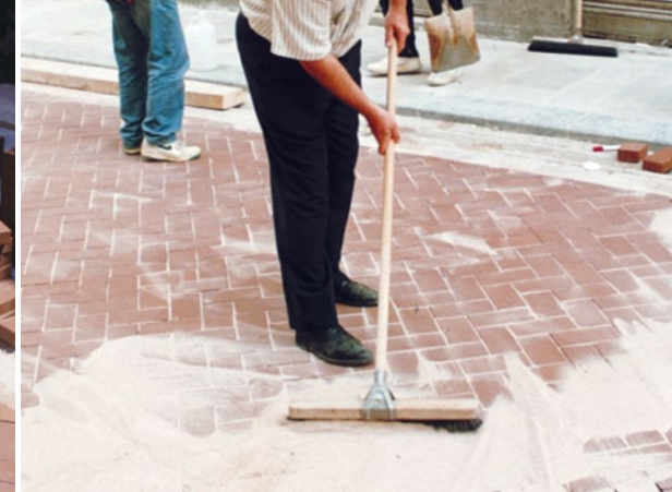
Rellenado de juntas

La colocación del adoquín se realizará evitando pisar la capa de arena, para lo que se trabajará sobre la parte ya ejecutada del pavimento, procurando no concentrar cargas debidas a apilamiento de material o a los mismos operarios cerca del borde de trabajo.