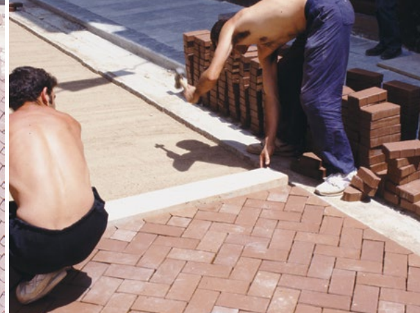
Alineado de adoquines