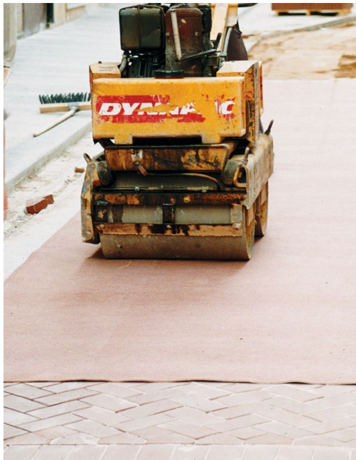
Compactado del adoquín. Utilizar vibradores con suela de goma, o bien extender una manta como en la foto para evitar desportillados

Completada la compactación, se comprobarán los niveles del adoquinado, rectificándose, caso de ser necesario, las piezas que hayan quedado fuera de rasante. Se recebarán las juntas que no estén llenas. Una vez retirados los sobrantes de arena es conveniente regar el pavimento para facilitar el apelmazamiento del árido. Tras esta operación, el pavimento estará listo para ser utilizado.