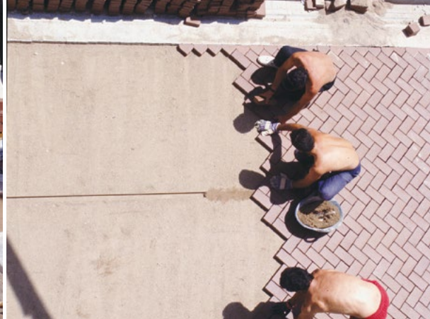
Colocación de los adoquines