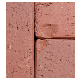
Junta a tope